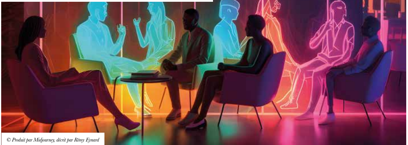
© Produit par Midjourney, décrit par Rémy Eynard

Dans un contexte technologique en constante évolution le designer doit savoir prendre position et agir en proposant une stratégie d'innovation adaptée à l'entreprise.