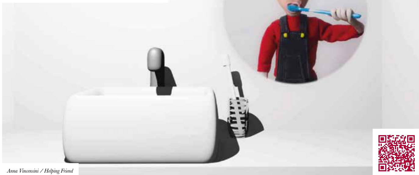
Anna Vincensini / Helping Friend