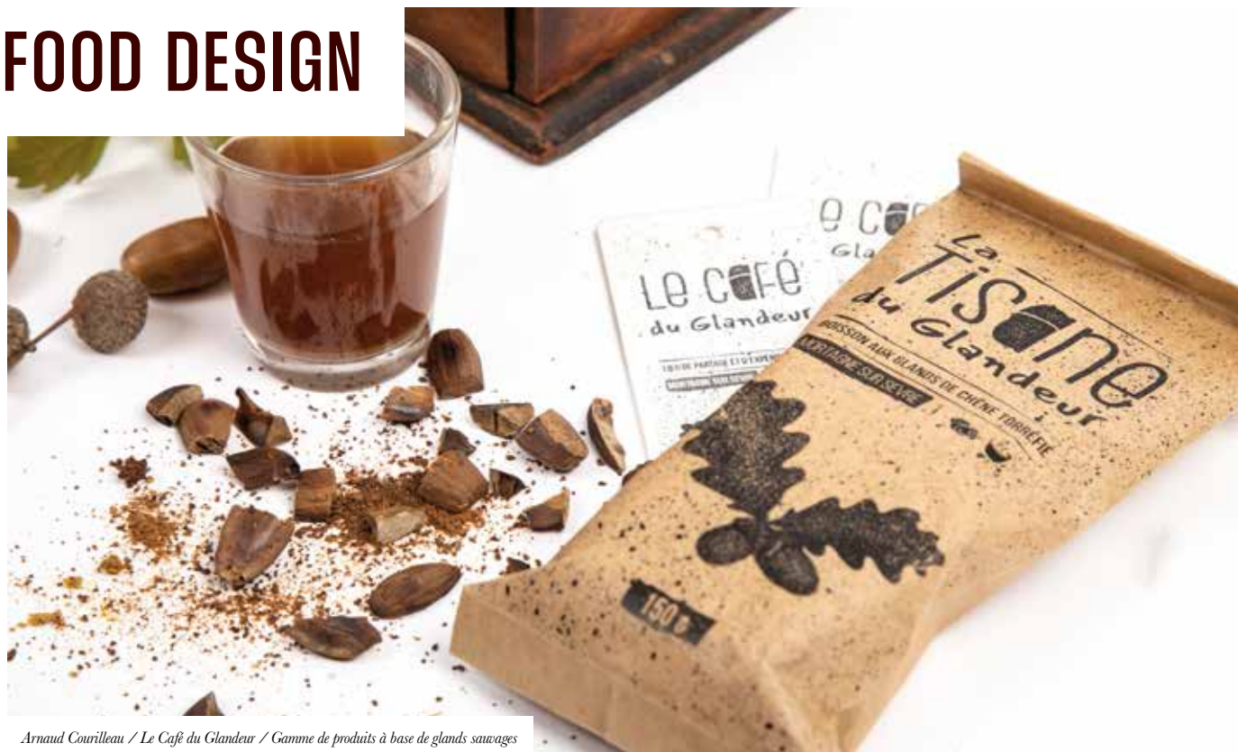
Arnaud Courvilleau / Le Café du Glandeur / Gamme de produits à base de glands sauvages

Devenir manager du design et de l'innovation pour les produits et services liés au système de l'alimentation.