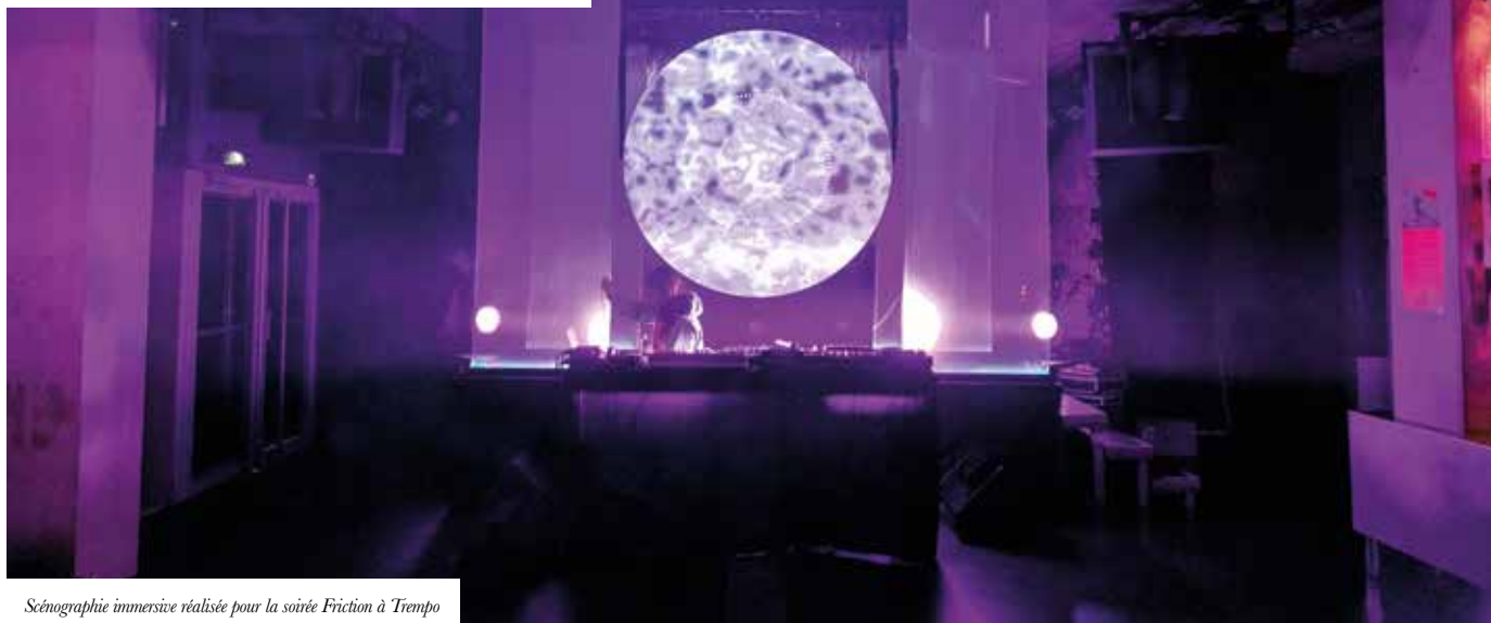
Scénographie immersive réalisée pour la soirée Friction à Trempo

La scénographie est une activité de conception qui permet de créer des espaces et des dispositifs éphémères ou pérennes, publics ou privés, mais aussi d'intervenir sur l'environnement (paysage, aménagement urbain etc.).