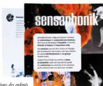
Julie Legal / Sensaphonik / Jeu d'écoute musicale pour libérer les émotions des enfants