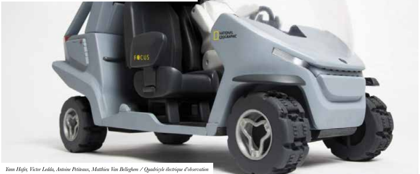
Yann Hafès, Victor Ledda, Antoine Petiteaux, Matthieu Van Belleghem / Quadricycle électrique d'observation

Le design transport est une activité de conception qui s'applique à l'ensemble des produits manufacturés permettant le transport de personnes ou de marchandises (transport collectif, urbain, nautique, aéronautique, automobile, ...) qu'ils soient fabriqués industriellement en grande série ou artisanalement.