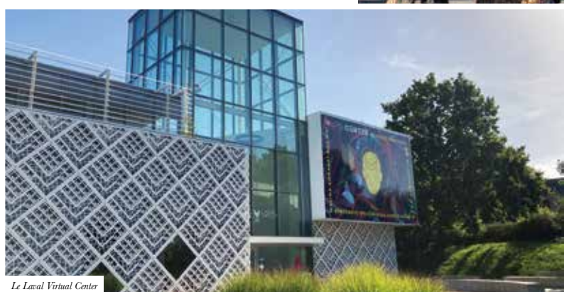
Le Laval Virtual Center