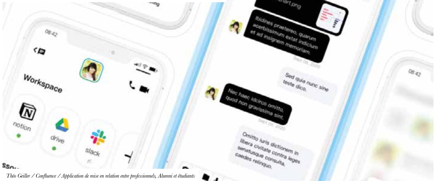
Théo Geïller / Confluence / Application de mise en relation entre professionnels, Alumni et étudiants

Dans la spécialité design d'interface, ce sont les différents types d'interfaces humain machine qui vont être spécifiquement travaillées