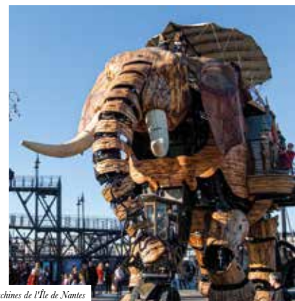
Les Machines de l'Île de Nantes